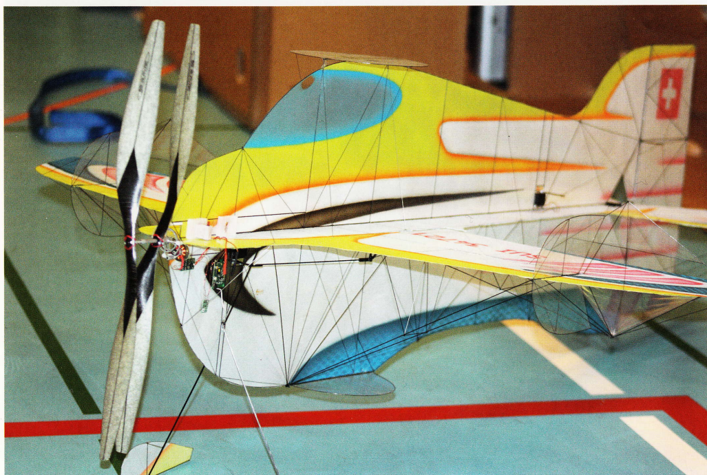
Merveille de technologie: 54 g, 89 cm, 2 hélices contrarotatives, moteur Glavak pour des vols acrobatiques lents à vitesse constante.