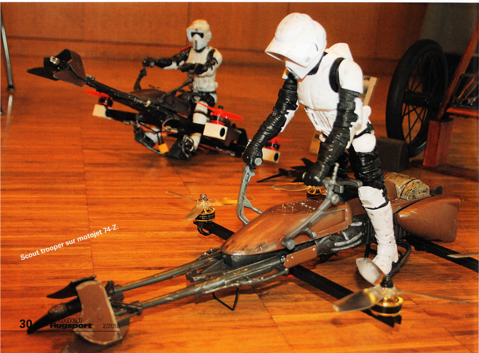
Scout trooper sur motojet 74-Z.